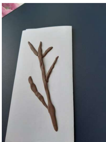
2. Ветка с веточками