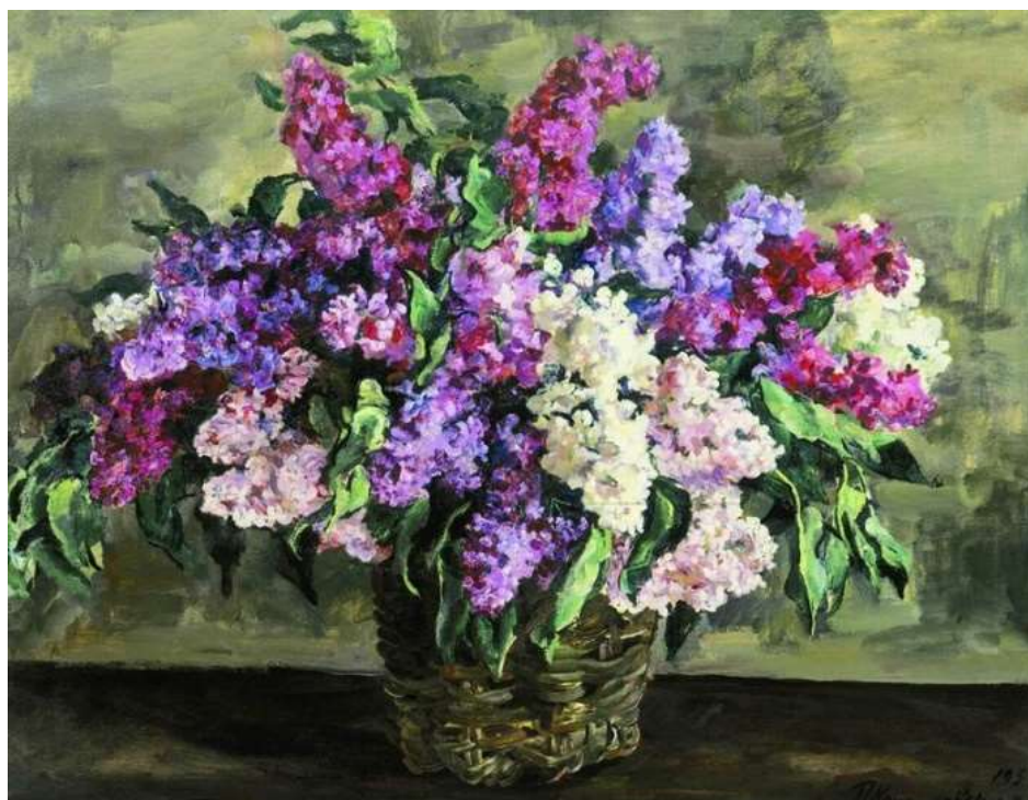
Пётр Кончаловский. «Натюрморт. Сирень в корзине ("героическая")» 1933