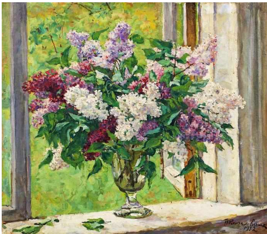
Пётр Кончаловский. «Натюрморт. Сирень в вазе на окне» 1952