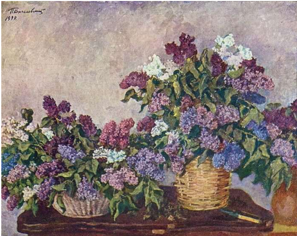
Пётр Кончаловский. «Натюрморт. Сирень в двух корзинах» 1939